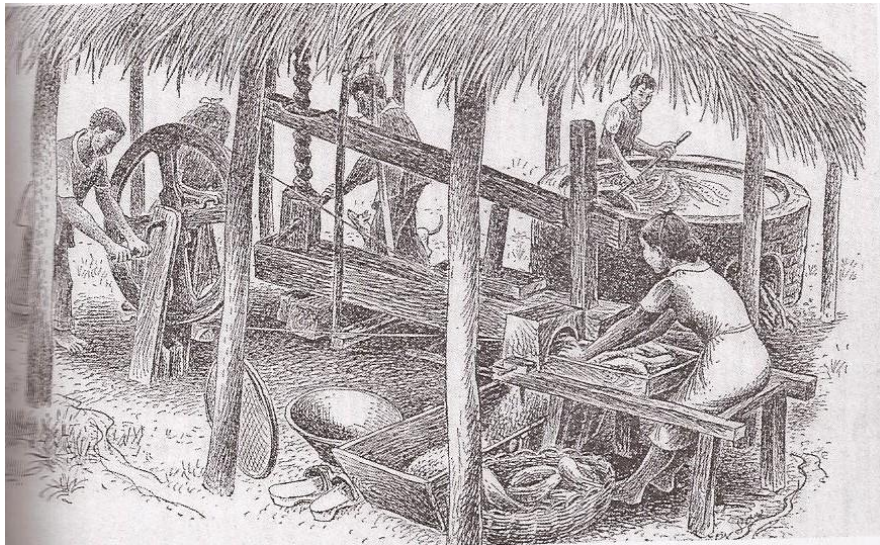
Figura 1 - Casa de farinha.

Fonte: Percy Lau. Tipos e aspectos do Brasil, apud Freire, Nem tanto ao mar tanto à terra , p. 85.