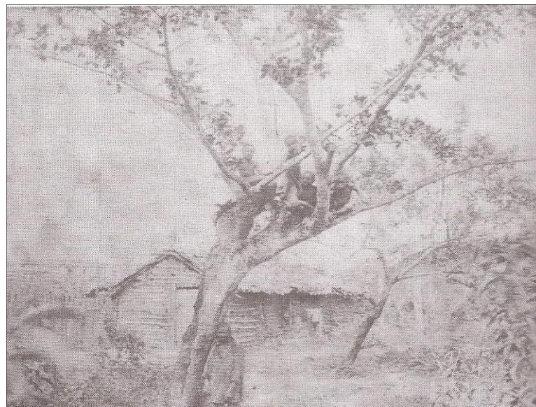
Figura 2 - Habitação dos cativos